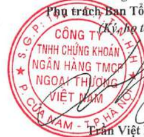
Trần Việt Hưng